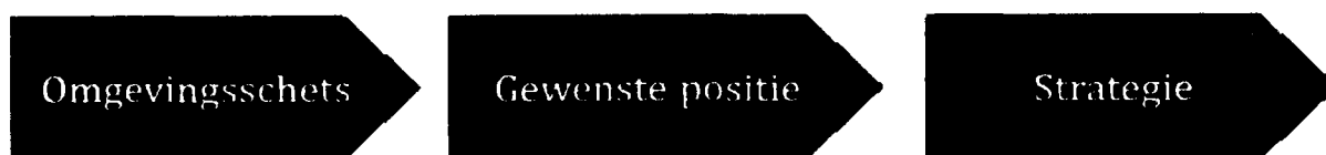
Fig. 1: Drie onderdelen van een visie

Wat betreft de omschrijving van het woord 'visie' zijn er veel definities in omloop. Voor goed begrip: bij een visie gaat het in onze optiek om een expliciet beschreven toekomstbeeld, dat bij voorkeur gedeeld wordt door alle belanghebbenden. In een visie maken wij onderscheid tussen drie onderdelen: een omgevingschets, een gewenste positie en een strategie.