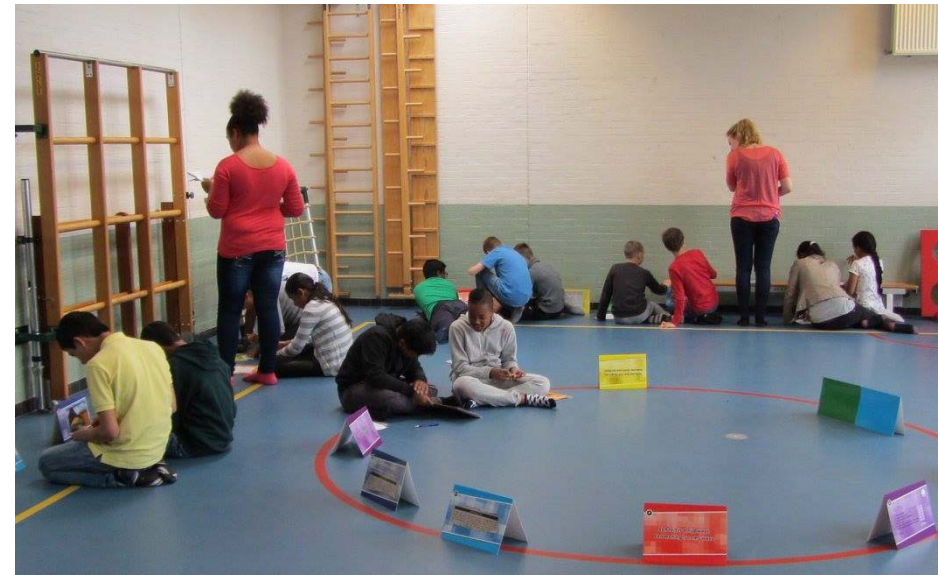
OBS De Achtbaan Almere: Gastles De vooroordelenreis