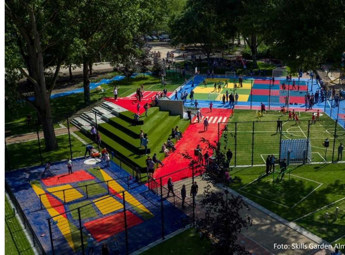
Foto: Skills Garden Alm

Sport inzetten als middel- of bijdrage voor maatschappelijke uitdagingen in de samenleving.