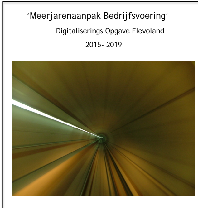
De meerjarenaanpak in 1 beeld: