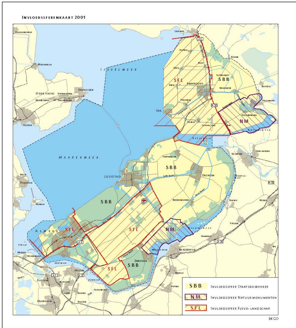
Bijlage 1: Invloedsferenkaart 2001