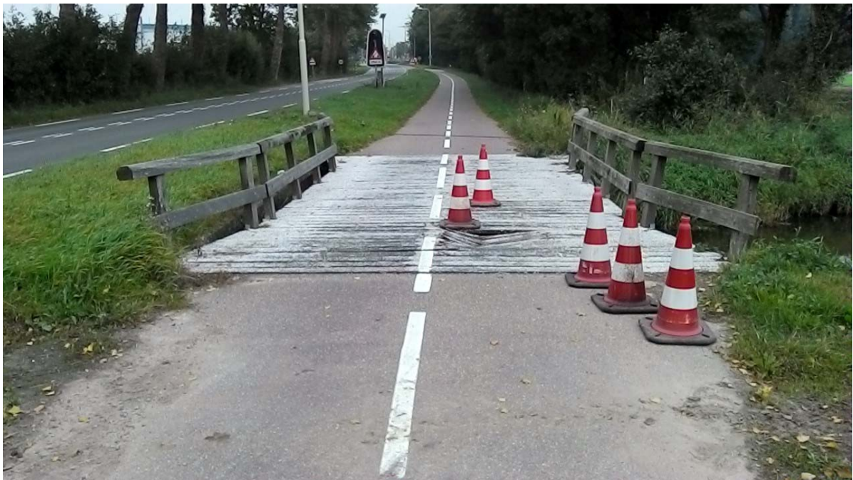
Bezwijken van een fietsbrug in de Gemaalweg (oktober 2013). Dit soort situaties veroorzaken stremmingen en zouden ook tot persoonlijk letsel kunnen lijden.

Nadat voor het proces de risico's zijn vastgesteld is vervolgens naar de inhoud van de onderzoeken gekeken. Op de inhoud is met name geconstateerd dat bij veel restlevensduur berekeningen wordt gewerkt met gevoelige parameters. Andere aannames kunnen snel tot andere uitkomsten leiden. Een voorbeeld is de intensiteit van een weg, die van invloed is op de totale belasting op de verharding of een brug. Als een verkeerde intensiteit wordt gehanteerd zal dit invloed hebben op de restlevensduur. Daarnaast kunnen ook op het gebied van de gehanteerde eenheidsprijzen onvolkomenheden zijn, waardoor achteraf kosten hoger/lager blijken te zijn.