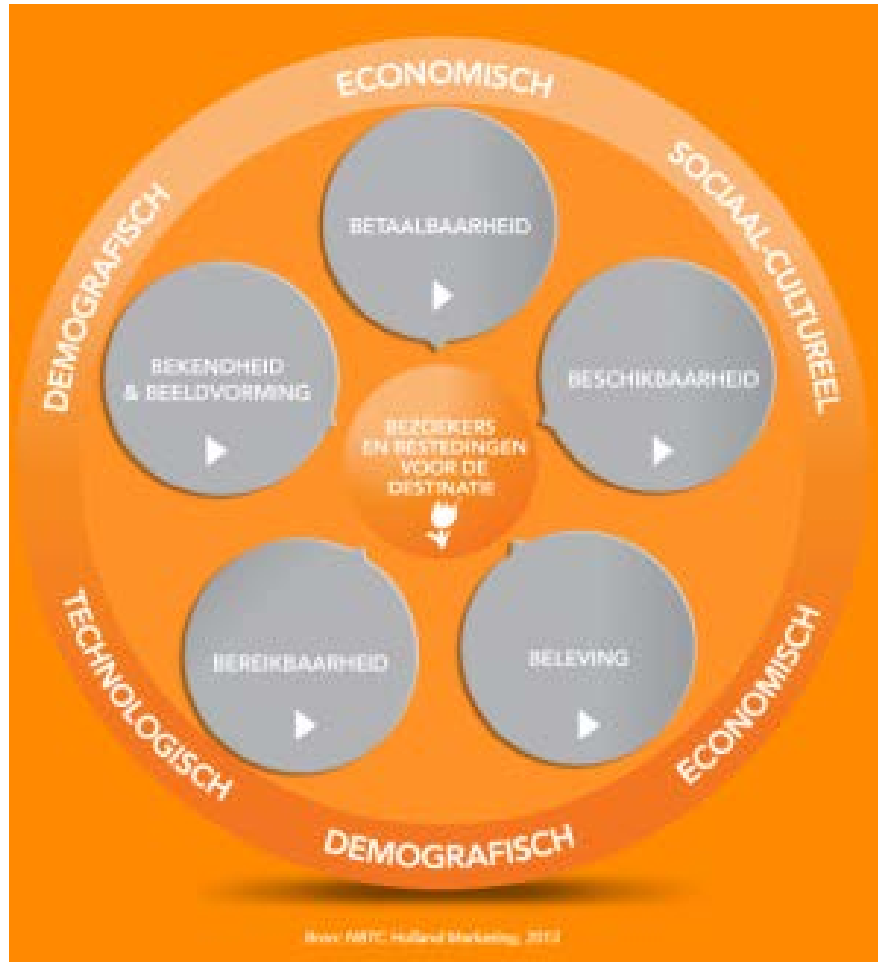
Figuur 3, 5 B's destinationontwikkeling

De groei van de kerncijfers; bezoekersaantallen, vrijetijdsactiviteiten, bestedingen en daaruit afgeleide werkgelegenheid, zijn sterk afhankelijk van een aantal randvoorwaarden/criteria, schematisch weergegeven in onderstaand figuur: