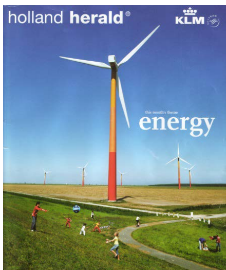
Kaft in flight magazine KLM 10/2006

Sinds de zomer van 2000 is op de locatie Almere Pampus het windpark Jaap Rodenburg 1 in bedrijf. De tien windturbines produceren jaarlijks schone elektriciteit voor 15.700 huishoudens. Het park is een markant punt op de hoek van de polder. De opvallende kleuren van de turbines (rood, oranje en geel) werden ontworpen door kunstenaar Mary Fontaine uit Almere en zijn uit drie ontwerpen gekozen door de kinderen uit groep 6 en 7 van basisscholen in Almere. Kinderen van basisschool De Kameleon in Almere kozen voor het thema 'vuur' omdat 'vuur uit het binnenste van de aarde komt', 'omdat de kleuren zo mooi overlopen', 'ze zo opvallend zijn', 'ze energie geven en dus warmte' en omdat ze 'als het oud en nieuw is net vuurpijlen lijken'.