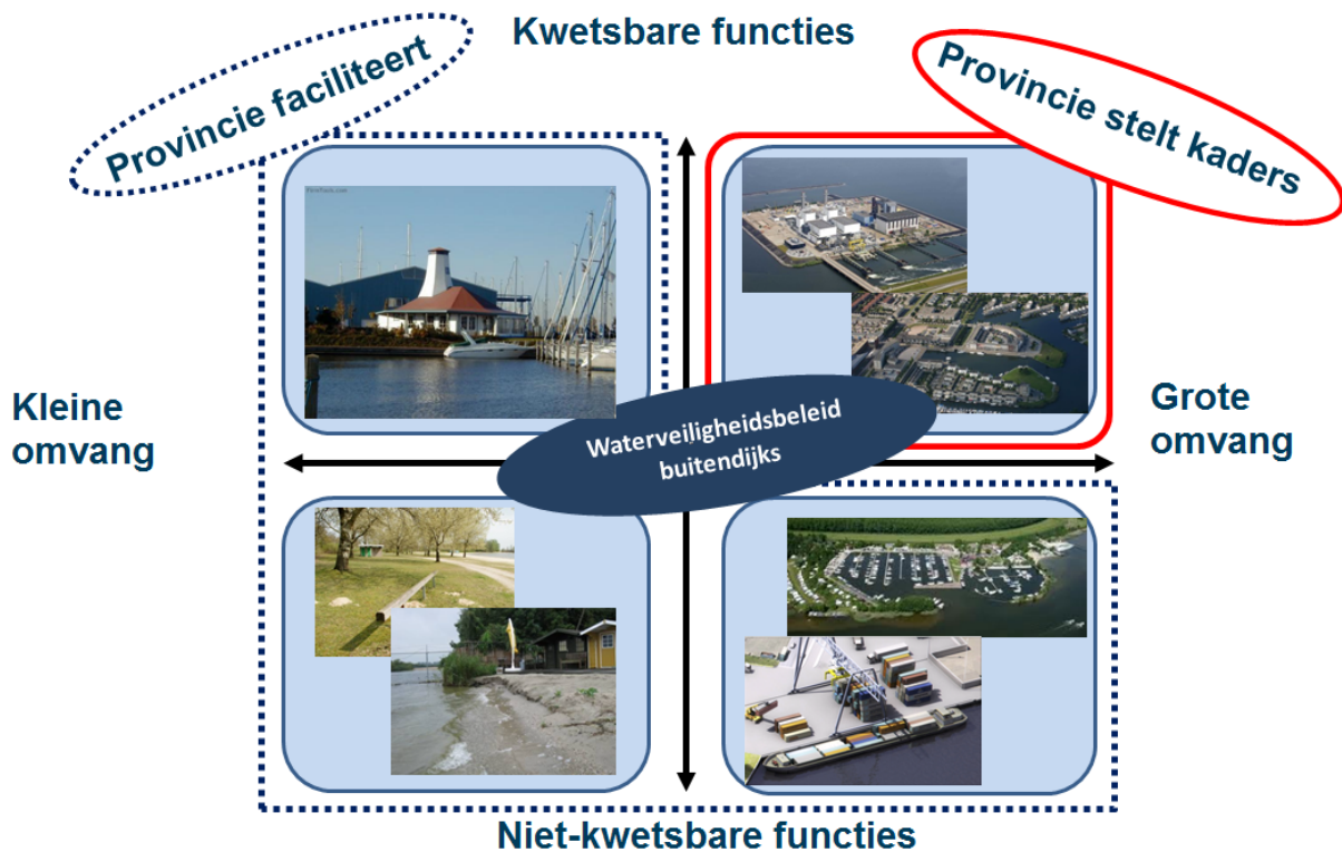
Figuur 3: provinciaal belang

De provincie maakt onderscheid tussen buitendijkse ontwikkelingen met én zonder een provinciaal belang. Dit onderscheid spitst zich met name toe op de omvang en de functies in deze buitendijkse gebieden. In onderstaand kwadrant is dit schematisch in beeld gebracht.