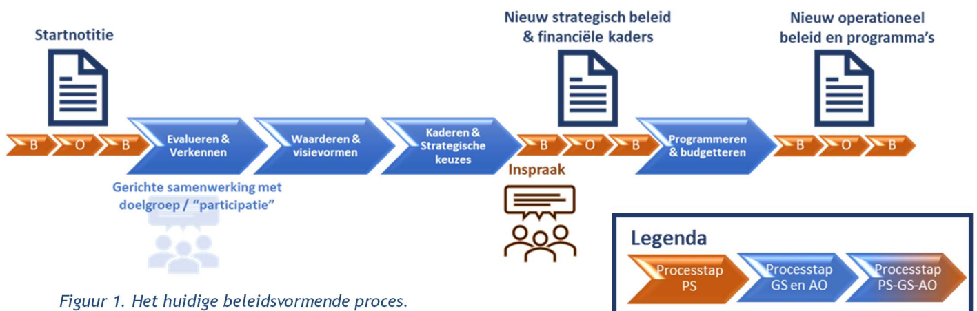
Figuur 1. Het huidige beleidsvormende proces.

Het huidige beleidsvormende proces biedt PS weinig ruimte voor voorkantsturing en kaderstelling. De huidige wijze van beleidsvorming is schematisch weergegeven in figuur 1.