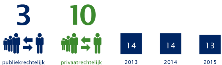
Aantal verbonden partijen in 2015