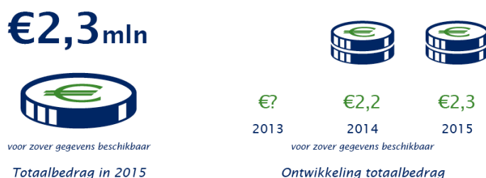
voor zover gegevens beschikbaar