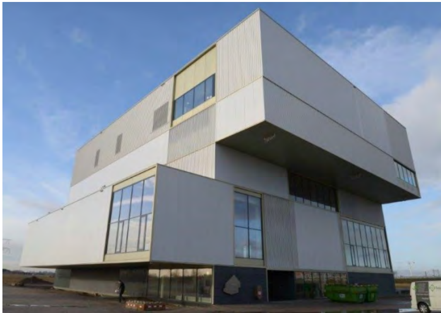
Almere Kenniscentrum Talent

De middelen die geprogrammeerd zijn voor IFA3 worden ingezet voor het programma Almere 2.0. De middelen (inclusief € 10 mln IFA2) worden, samen met de middelen van de gemeente Almere en het Rijk, op basis van door PS vast te stellen jaarprogramma's, gestort in het Fonds Verstedelijking Almere, dat door de gemeente Almere wordt beheerd.