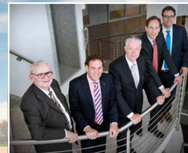
WIJ HOUDEN DE AGENDA VITAAL PLATTELAND LEVEND