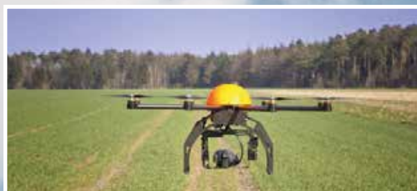
Pionieren, Keten en Innovatie