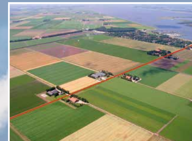
Leefbaarheid en Duurzaamheid vormen samen de rode draad door de Agenda.

SAMEN hang tussen agendapunten vraagt om Actieve Dialoog