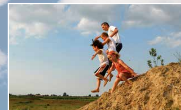
5 agendapunten in andere visies Recreatie • Landschap Archeologie Cultuurhistorie Erfgoed • Ontsluiting • Duurzame Energie • Natuur