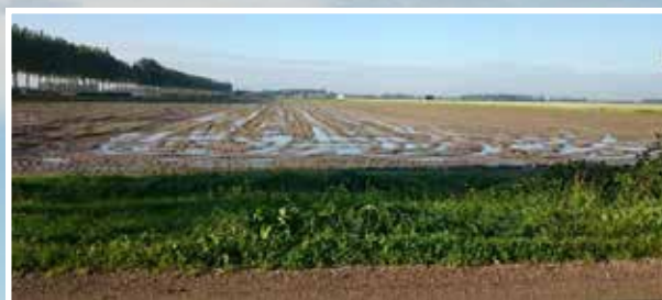
Bodem en Water, Bodemdaling