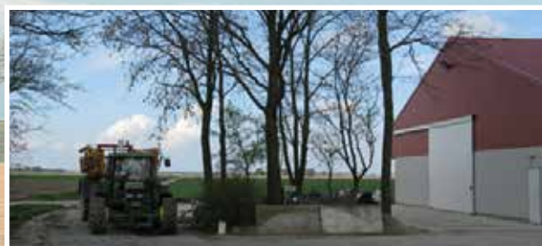
Erf Zoekt Kans, Erfgrootte