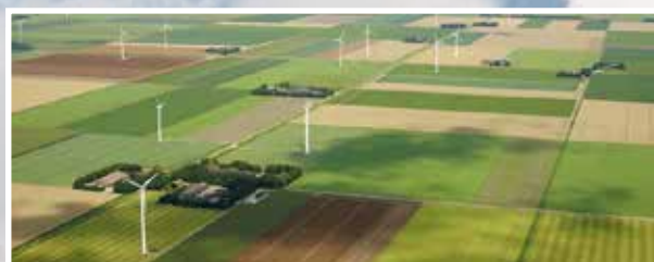
Agrarische Structuurversterking, Schaalvergroting