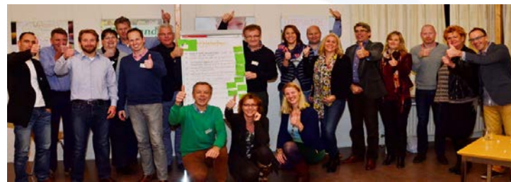
De energieke samenleving