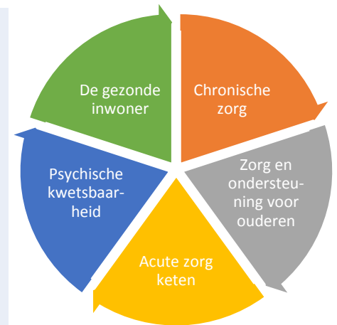
5 thema's regiobeeld

De werkgroep zal per thema op deze onderwerpen een overzicht bieden van (cijfermatige) inzichten op lokaal en regionaal niveau en inzicht te geven in de verwachte toekomsttrends. Hierbij is het uitgangspunt dat de werkgroep een pragmatische aanpak heeft, waarbij gebruik gemaakt wordt van beschikbare data. Daarnaast zal per thema aangegeven worden welke regiopartijen betrokken zijn bij dat deel van de zorgketen. Op basis van deze inzichten zal de werkgroep een eerste duiding aan de uitkomsten geven.