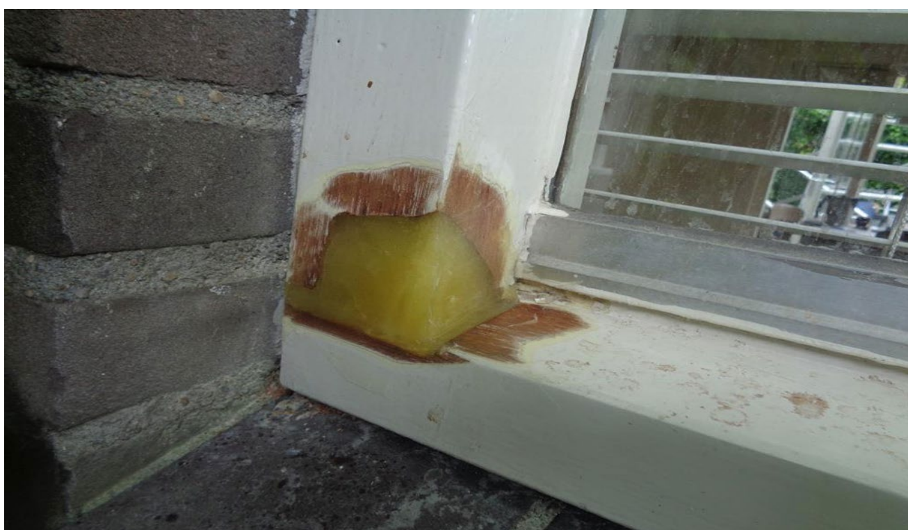
Niet Jaarlijks Onderhoud