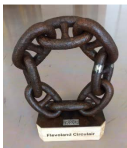
Figuur 2 - Wisselbokaal Keteninitiatieven Circulaire Economie

Het Letter of Commitment is vertaald naar 'een Verklaring Keteninitiatief'. Het moment van tekenen wordt ondersteund met de uitreiking van een wisselbokaal (figuur 2).