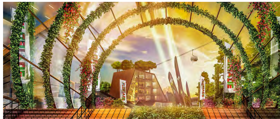
Artist impression sferbeeld Floriade

Om een wereldtentoonstelling te mogen organiseren, is formele erkenning nodig van het BIE in Parijs. Op 15 november 2017 is deze formele erkenning een feit geworden, tijdens een bijeenkomst in Parijs. De Floriade B.V. gaat zich richten op een beperkt aantal wereldsteden die zich ook actief bezig houden met de Growing Green Cities thema's. Zij worden actief benaderd om hun innovaties op de Floriade te tonen. De Floriade Dialogues worden hierbij één van de middelen. Een architectencompetitie voor de bouw van de stedenpaviljoens is in voorbereiding.