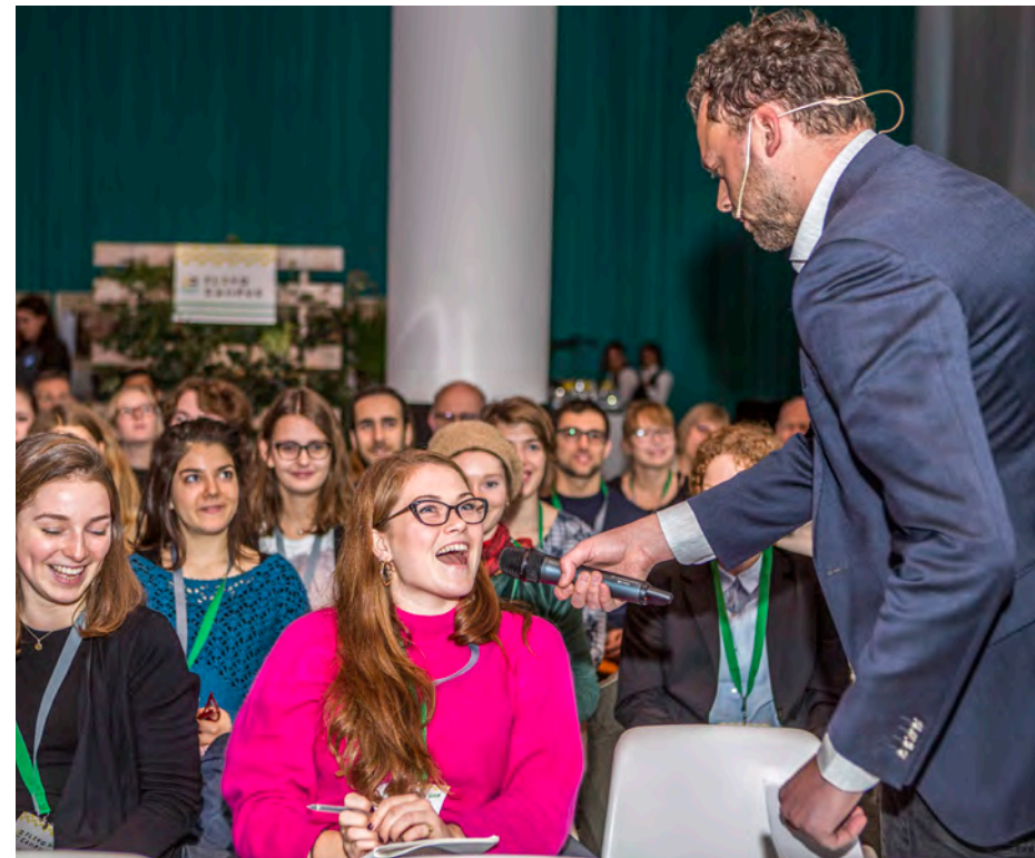
Bijeenkomst Flevo Campus

Er is een start gemaakt met de opzet van een denktank van jong talent om samen te werken aan innovatieve oplossingen voor de stedelijke voedselvoorziening.