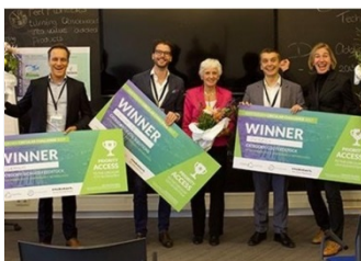
Drie winnaars Amsterdam

De provincie Noord-Holland heeft besloten de definitieve vergunningen te verlenen voor de windparken Havenwind en Nieuwe Hemweg in Amsterdam. Beide windparken vallen onder de zes herstructureringsprojecten voor Wind op Land. > Lees meer