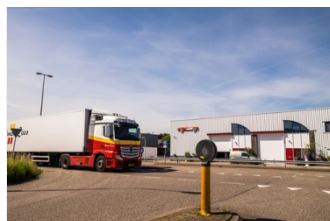
Prijsvraag MRA: slimme en schone