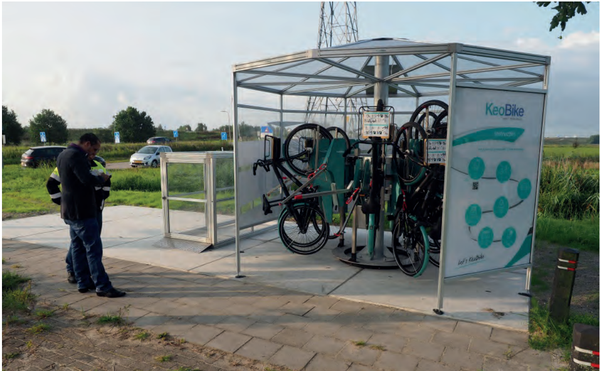
Foto: het deelfietsconcept van KeoBike bij Stichtsekanal in Almere.