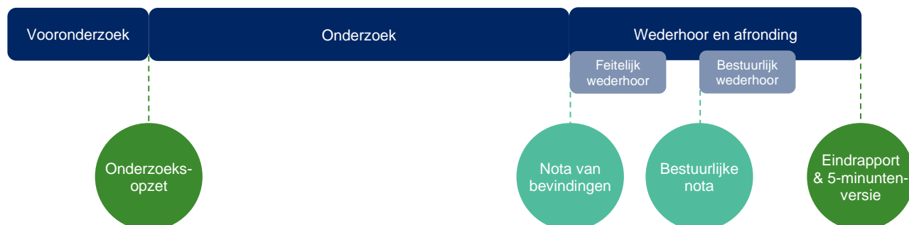
Figuur 1 – Onderdelen en producten onderzoek

Het streven is om het rapport in het najaar van 2022 te publiceren. In Figuur 1 zijn de fasen van het onderzoek en de verschillende producten weergegeven.