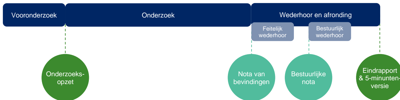
Figuur 1 Onderdelen en producten onderzoek

Het streven is om het rapport in het derde kwartaal van 2022 te publiceren. In figuur 1 zijn de fasen van het onderzoek en de verschillende producten weergegeven.