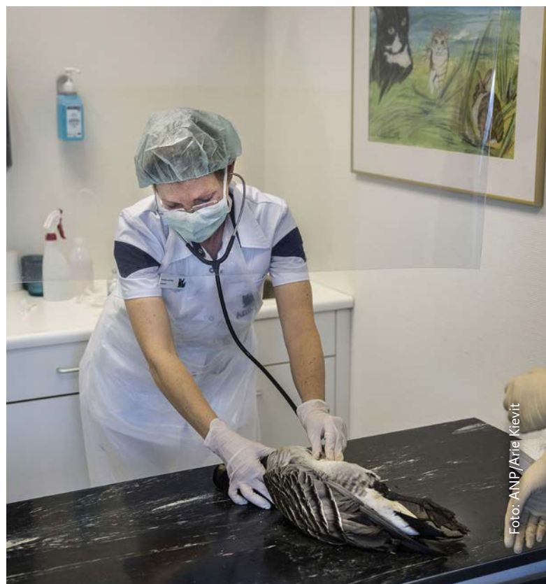
Hulp aan dieren vereist noodzakelijke deskundigheid, ook vanwege de eigen veiligheid