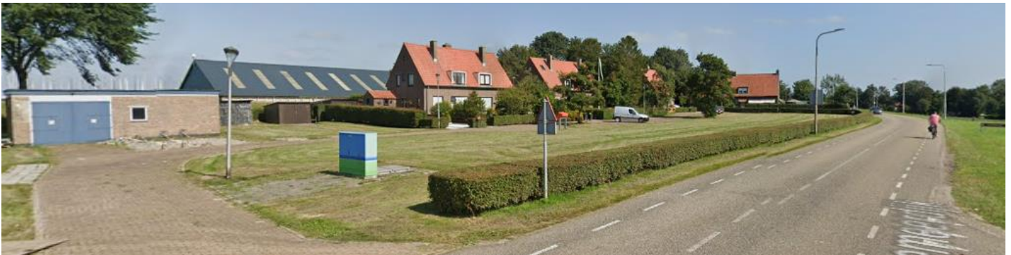
Een grasveld aan de Vossemeerdijk, net na de Ketelsluis, is een mooie en goede locatie om het begin en eindpunt van lijn 5 te realiseren.