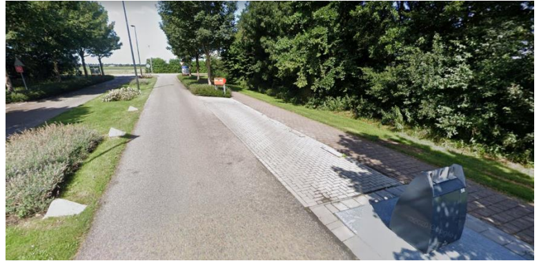
Beoogd begin- en eindpunt lijn 1 "Golfresidentie"

Voor de halte zal ook wat ruimte gemaakt moeten worden. De bus moet van de weg kunnen halteren om voor het starten voor de nieuwe rit naar het Station de tijd af te kunnen wachten, zonder dat deze anderen hindert of blokkeert om het park af te rijden. Een plek om tijdelijk fietsen of brommers te stallen is hier ook gewenst. Bewoners die achterop het park wonen zullen namelijk met de fiets naar de bushalte komen.