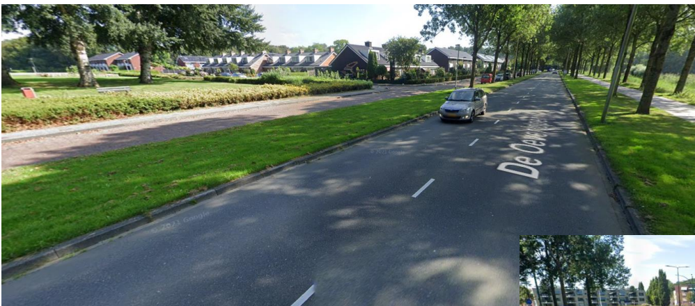
De haltes “De Oeveloper” en “De Wissel” worden voor deze lijn weer hersteld, zoals deze eerder ook waren voor lijn 143 naar Kampen