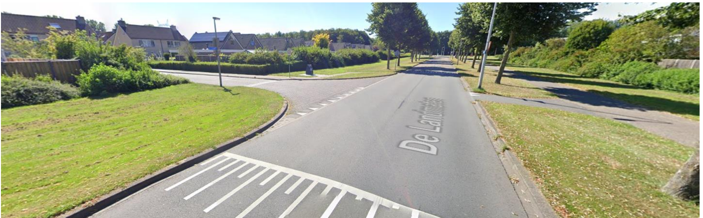
Wellicht een extra halte op lijn 2, ter hoogte van kruising De Landmaten met De IJslander?